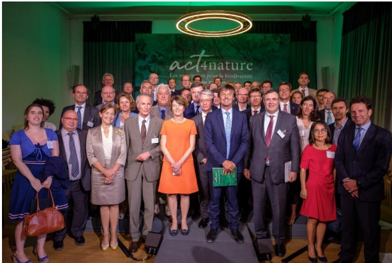
Lancement d'act4nature en 2018